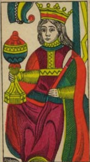
REINE DE COUPE.