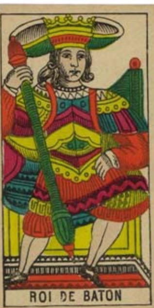
ROI DE BATON