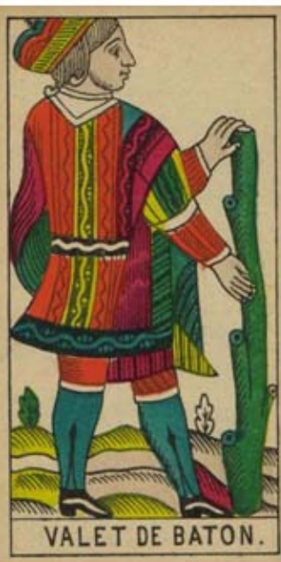
VALET DE BATON.