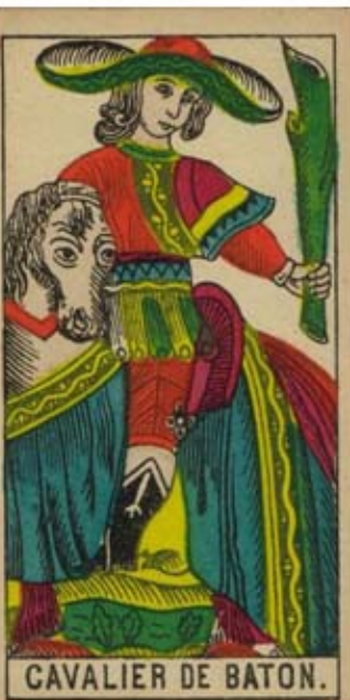
CAVALIER DE BATON.