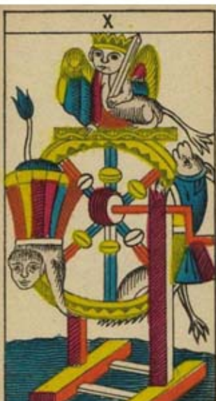
LA ROUE DE FORTUNE.