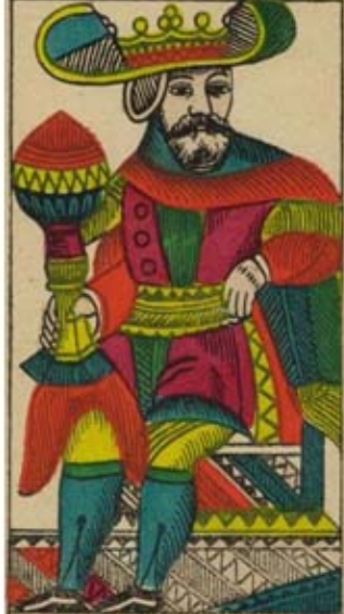
ROI DE COUPE