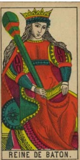
REINE DE BATON.